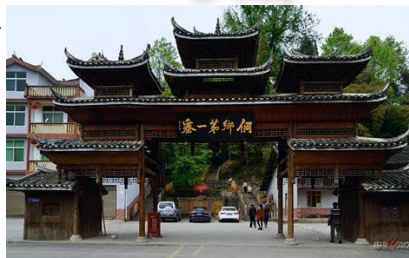
『楓香坡侗族風情寨』

『梭布垭石林』:梭布垭石林被稱為世界第一奧陶紀石林，是國家4A級旅遊景區，整個石林外形象一隻巨大的葫蘆，四周翠屏環繞，群峰競秀。目前開放的有青龍寺、蓮花寨、磨子溝、九龍匯四大景區，每個景區各具特色，景區內獨特的“溶紋”、“戴冠”景觀，是一大亮點，狹縫秘境、化石古蹟隨處可見，堪稱一座遠古地質博物館。